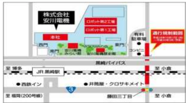
北九州会場地図 ↑ …JR 黒崎駅から徒歩 7 分